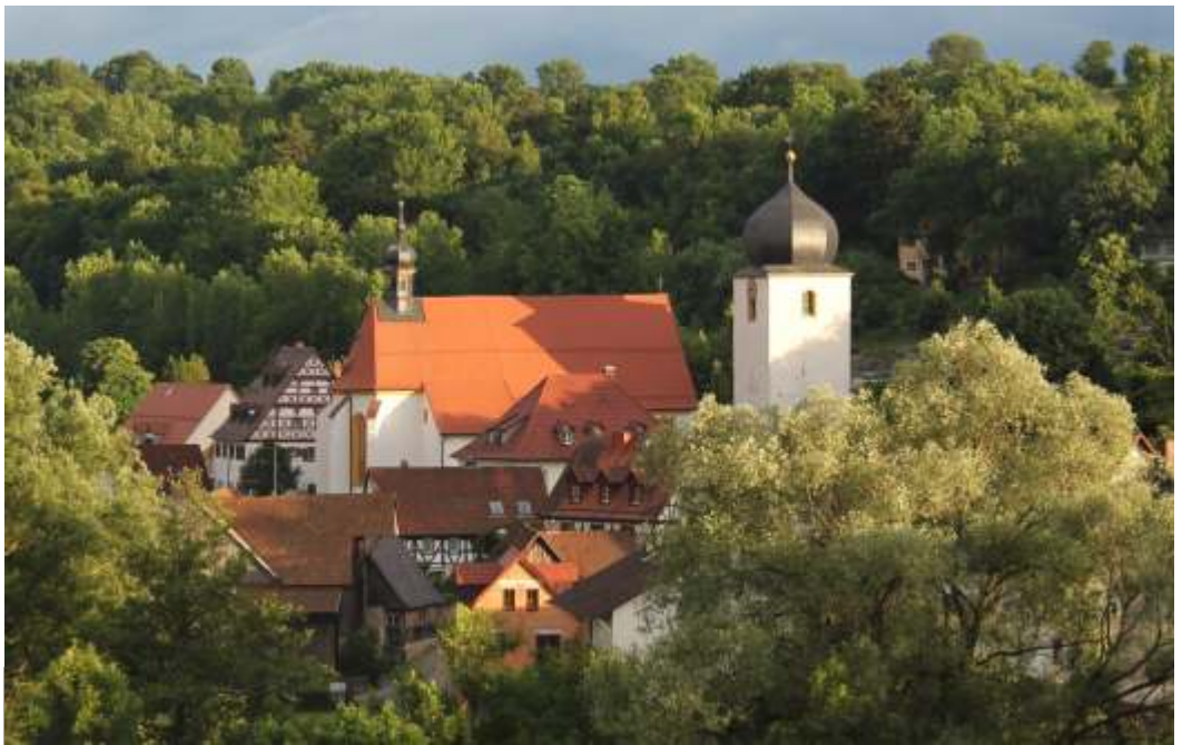
St. Veit Michaelskirche Heiligenstadt